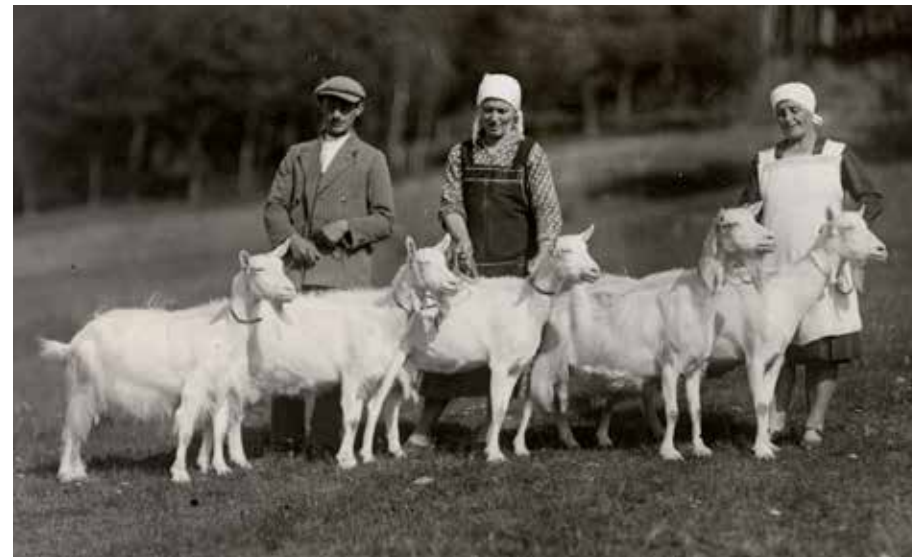
Kontrolované kozy bílého ušlechtilého plemene moravského, 30. léta 20. století