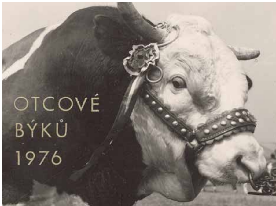
Katalogy otců býků, 1976-1981