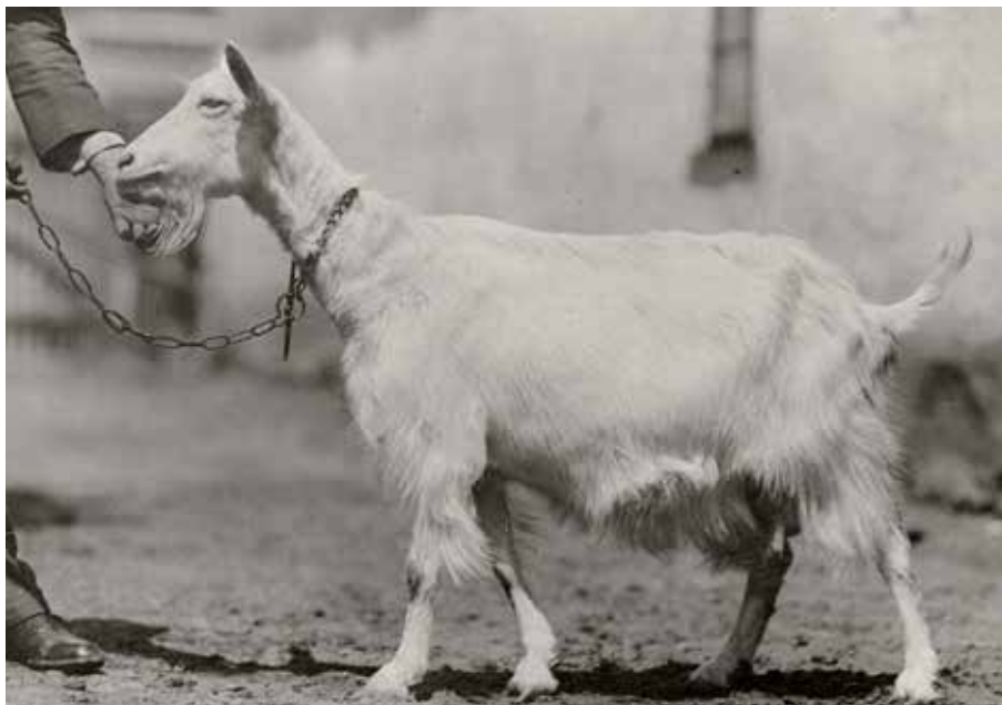
Plemenná koza Algira a121 bílého bezrohého ušlechtilého plemene moravského, 30. léta 20. století