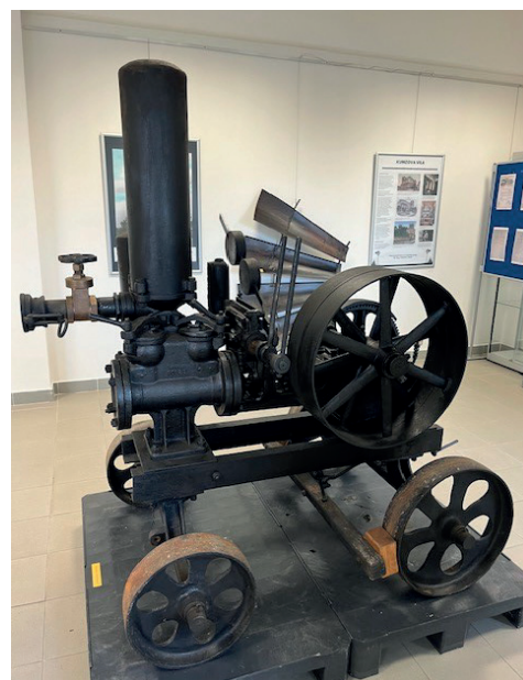
Dvojčinné plunžrové čerpadlo