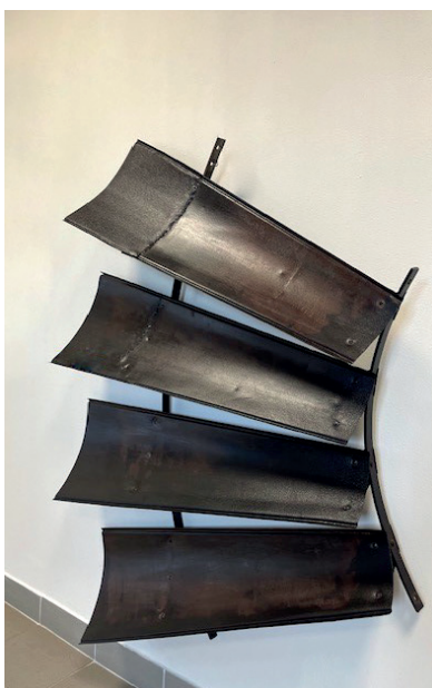
Část oběžného kola větrného motoru Kunz