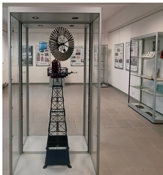
Model vodního čerpadla s větrným pohonem

Tato výstava je nejen poctou minulosti, ale také inspirací pro budoucí inovace v oblasti čerpačích techniky.