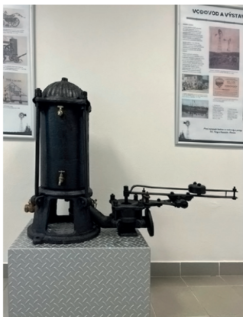
Trkač firmy Kunz